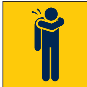
Husten- und Nies- etikette